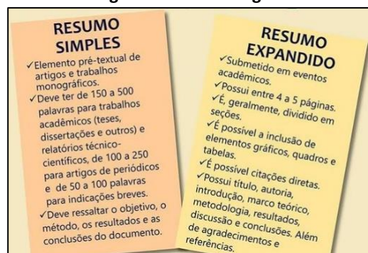
Figura 1: Título da figura