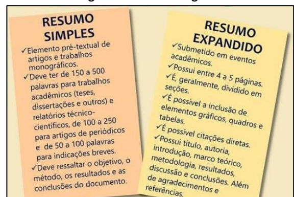
Figura 1: Título da figura

As figuras que não couberem no espaço da coluna devem ser colocadas ao final do resumo expandido. Devem ser apresentadas com boa resolução de modo que seja possível visualizá-las sem problemas. Ex.: